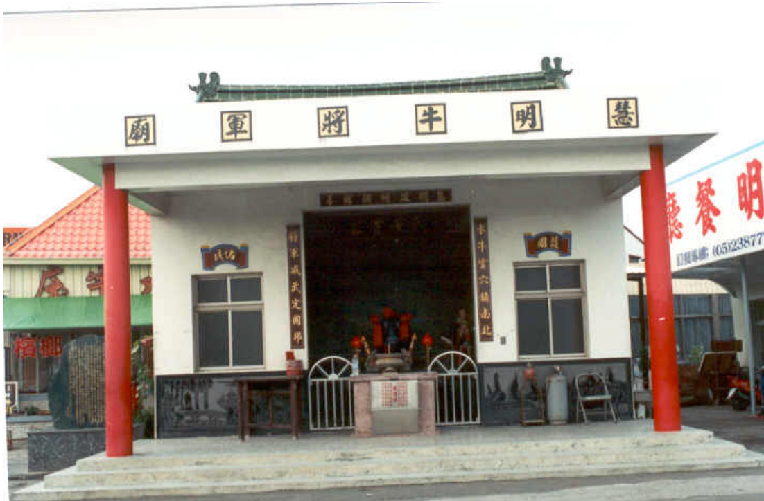
圖 2 牛將軍廟前視圖