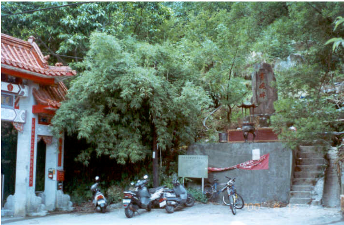
圖 5 獸魂碑與廟宇牌樓位置關係圖